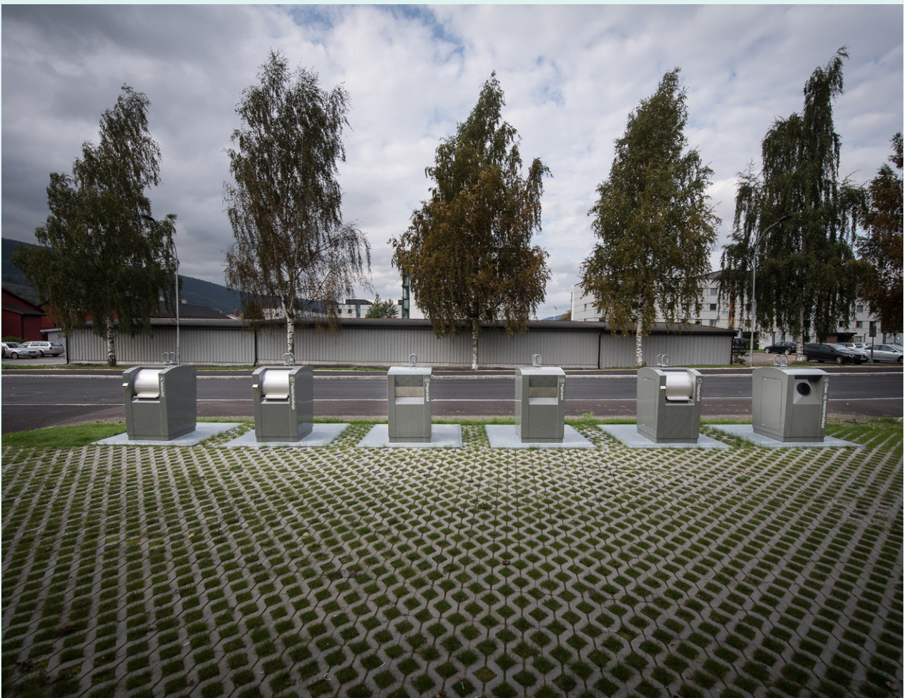
Nedgravde avfallsløsninger benyttes i stadig større grad på større samarbeid.

Disse løsningene krever at det hentes inn gode beslutningsgrunnlag og må testes grundig før de eventuelt innføres.