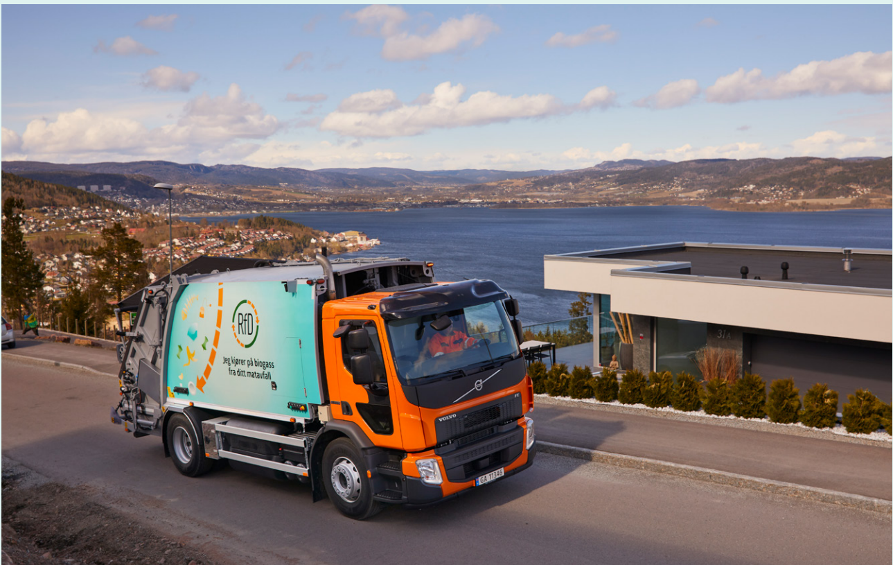
Det er betydelige kostnader knyttet til avfallshenting, og unødvendig kjøring belastes også innbyggerne.

De økonomiske konsekvensene av å ikke gjennomføre tiltakene er beregnet til mellom 14 og 20 millioner kroner årlig. Merkostnaden vil utgjøre ca. 5 prosent av gebyret, i tillegg til forventet kostnadsutvikling. Dette vil treffe innbyggerne urettferdig ved at det også belastes de som har lite avfall og sorterer godt.