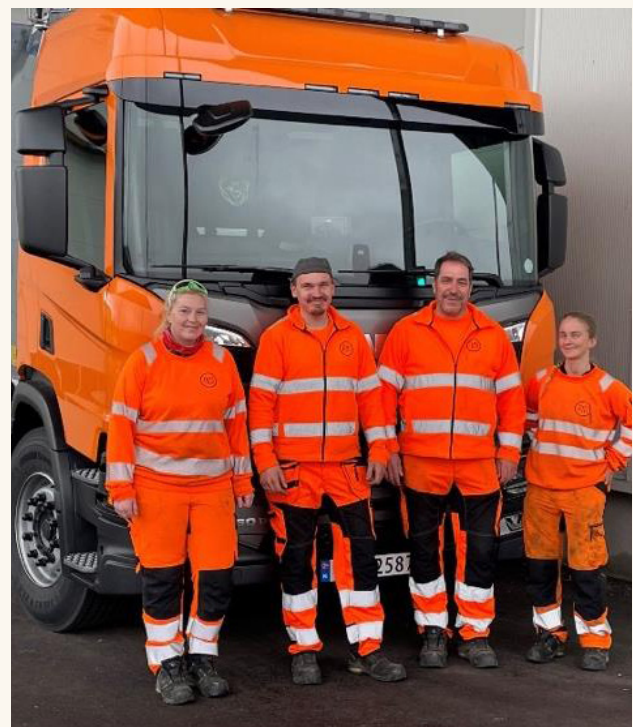
Utløp av innsamlingskontrakten er et naturlig tidspunkt for endringer.

Gebyrene som foreslås høsten 2026, med virkning fra 2027, vil ta utgangspunkt i den nye prismodellen. Vi legger opp til god en prosess i forkant av dette, med tid til drøfting og politisk forankring.