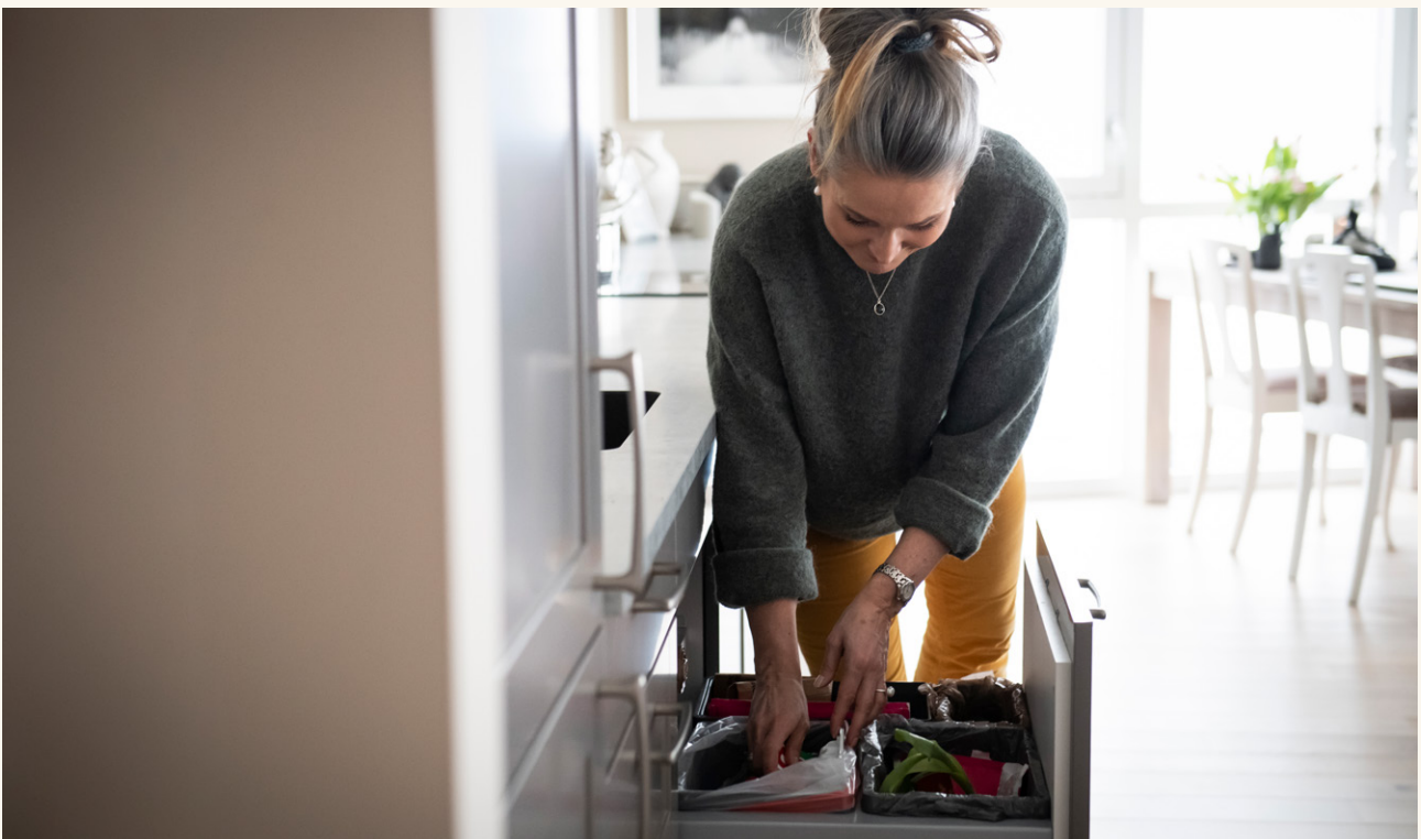
Ny gebyrmodell gir besparelser for de som bidrar til felles måloppnåelse.

Gebyrsystemet vil detaljeres og konkretiseres før det legges frem til endelig behandling.